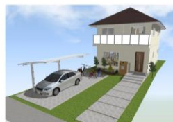
外観参考プランバス